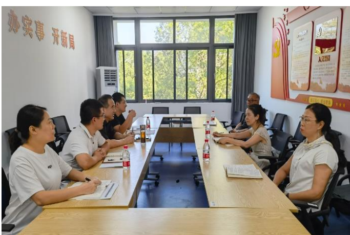
走访动物科技学院、动物医学院