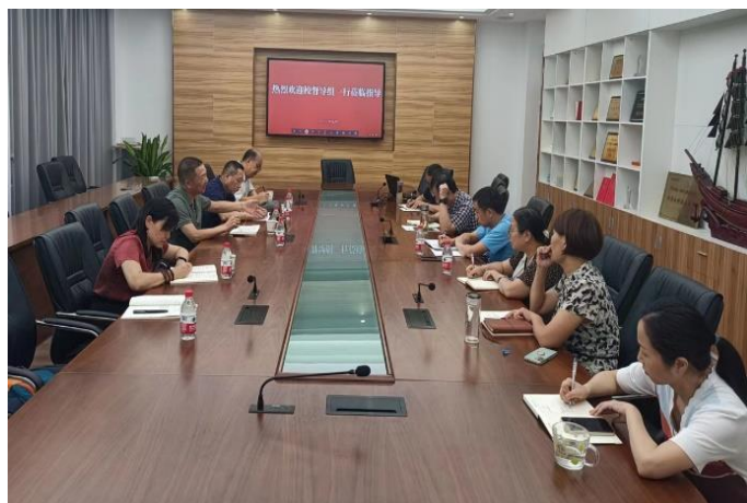
走访数学与计算机学院