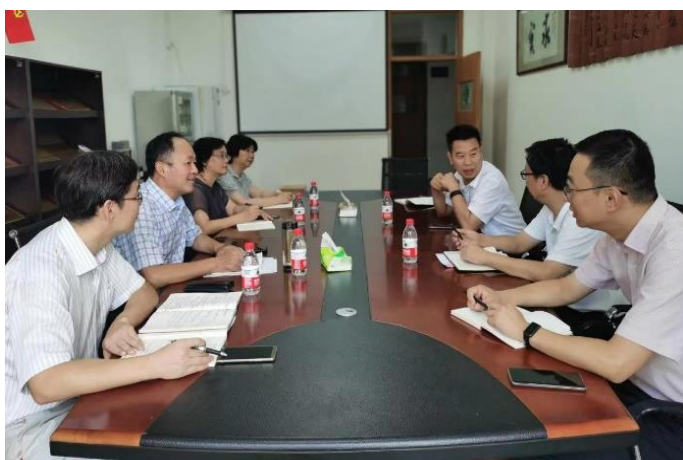
走访化学与材料工程学院