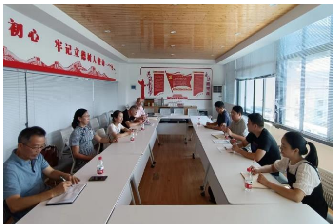
走访林业与生物技术学院