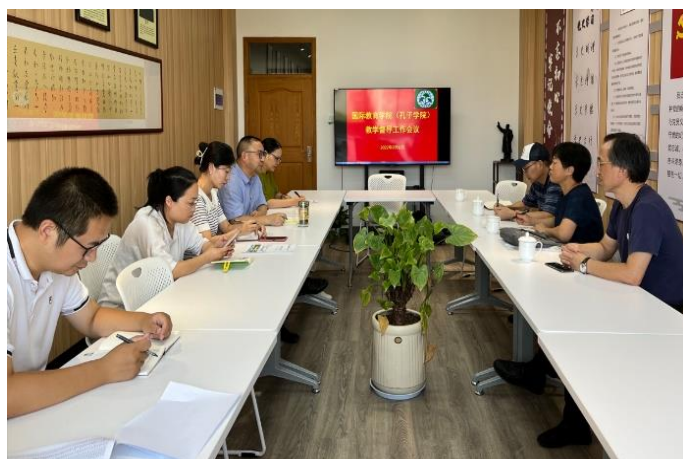
走访国际教育学院