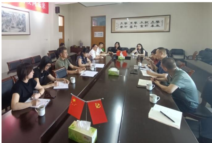
走访风景园林与建筑学院