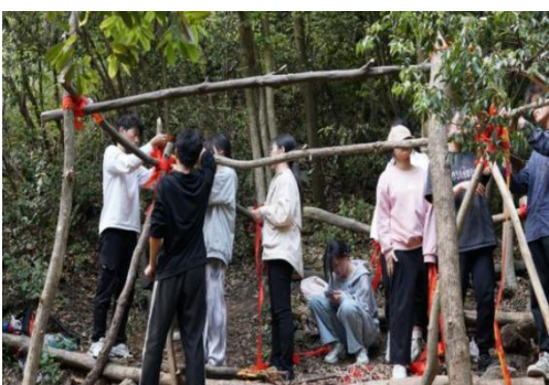
庇护所搭建（野外绳结应用）