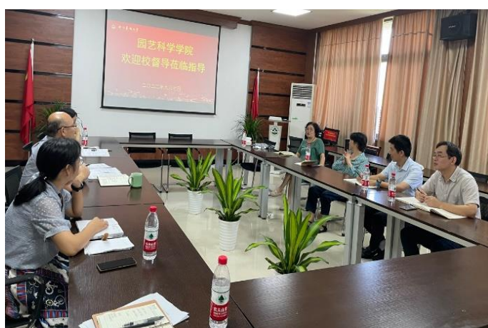
走访园艺科学学院