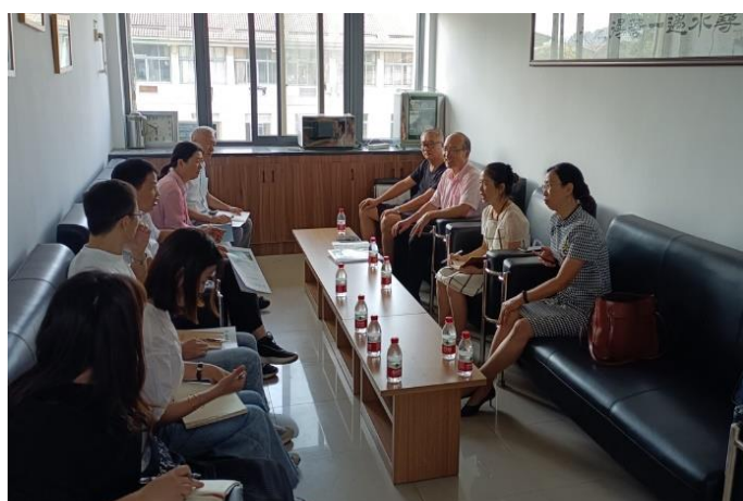
走访环境与资源学院