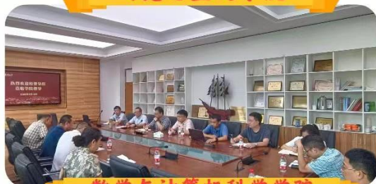
数学与计算机科学学院