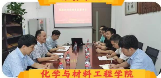
化学与材料工程学院