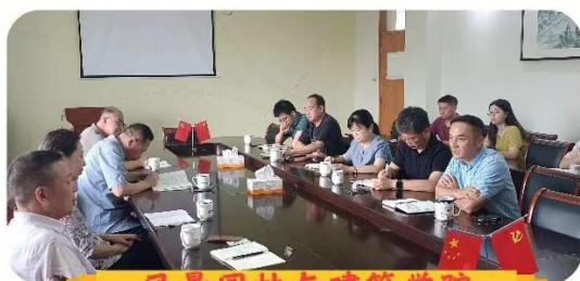
风景园林与建筑学院

走访期间，各位校督导向学院汇报上学期听课情况和试卷论文抽查情况，反馈教师授课、毕业论文指导以及考试等各个环节中值得肯定的方面，同时也指出教育教学中存在的问题，并提出意见和建议。督导组向各学院分享校督导组本学期的工作计划，并结合审核性评估工作的开展情况，向学院征求如何更好开展教学督导工作的意见与建议。另外，督导组还就如何提升青年教师教学能力、如何更好地监控通识选修课程和实践类课程、如何进一步加强校院两级教学督导的联动等问题，与学院相关人员进行了深入的沟通和交流。